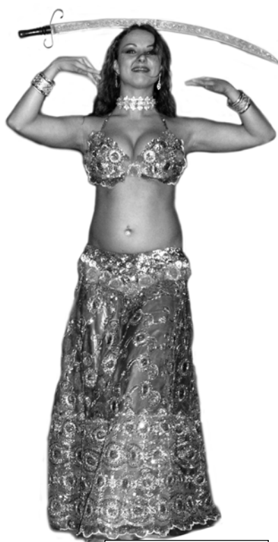
Востока без танца живота не бывает!