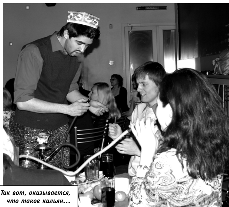
Так вот, оказывается, что такое кальян...