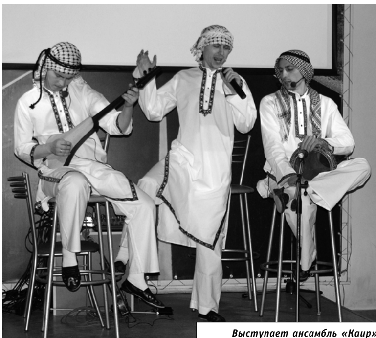
Выступает ансамбль «Каир»

Так что до новых встреч в «Гостиной у ректора»!